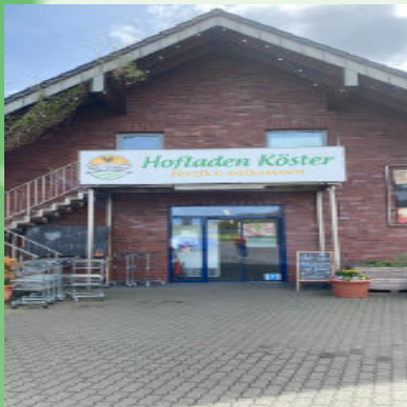
Köstershof Gabelstr. 71