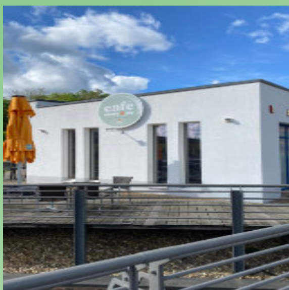
Café Mary & Joe Platz d. Guten Hoffnung